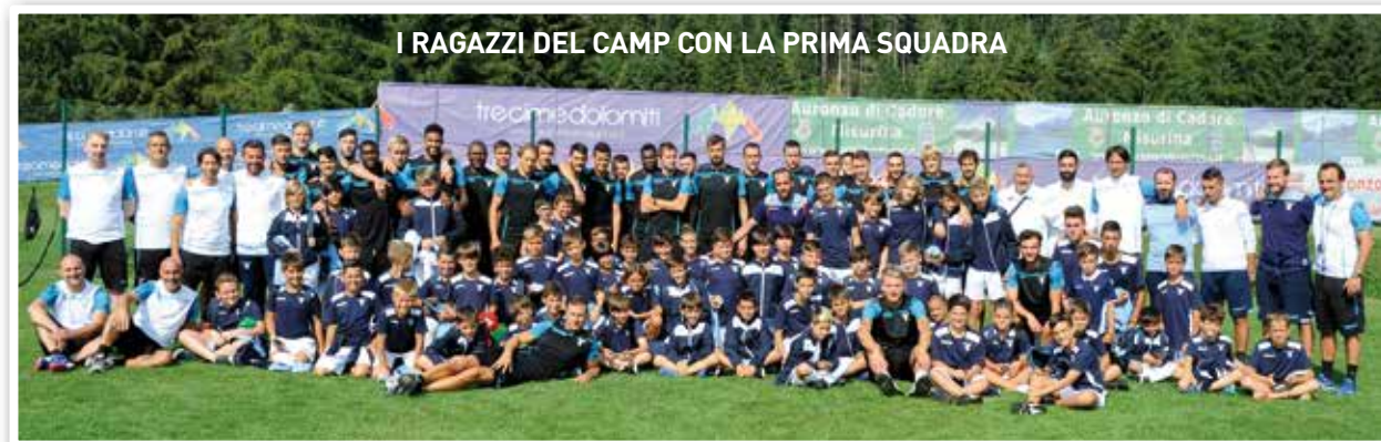
I RAGAZZI DEL CAMP CON LA PRIMA SQUADRA

Tornano i Lazio Summer Camp, i camp estivi dedicati a ragazze e ragazzi dai 6 ai 16 anni. L'obiettivo è offrire una vacanza da sogno, in cui il divertimento dei ragazzi e la crescita sportiva si fondono nell'unicità dell'esperienza calcistica all'insegna dei colori biancocelesti. Il tutto sotto la guida e l'esperienza di uno staff di primo livello: saranno presenti, infatti, allenatori e preparatori del Settore Giovanile della S.S. Lazio. Ogni sede avrà un direttore responsabile, che coordinerà il Camp. Sarà garantita un'adeguata assistenza medica e la sorveglianza 24 ore su 24.